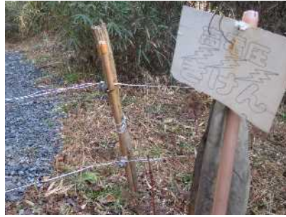
高圧電流の流れる電線

5) ごみは各自持ち帰るよう徹底してください。会場にも放置していかないこと。みんなのフィールドです。お互い気持ちよく使いましょう。