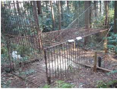
動物をしかけるわな